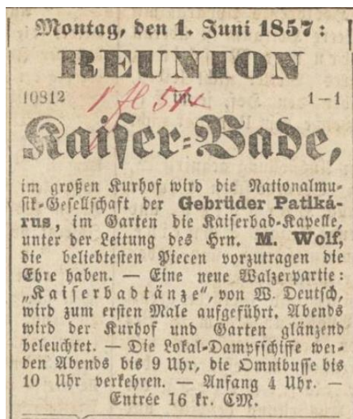
7. ábra. A Császárfürdőben rendezett első reünió 1857. június 1-én