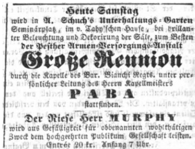
4. ábra. A Pesth-Ofner Localblatt und Landbote egy hirdetése, 1857. szeptember 5.

A hirdetések kiemelése elsődleges, hiszen ez alapján sikerült egyáltalán a pest-budai zeneélet szerkezetének működését szélesebb perspektívában felvázolni. Csak hogy az arányokat illusztráljuk: a zeneoktatással kapcsolatban 54, a reuniókról 446, a vendéglátóipari egységekben és kerthelyiségekben rendezett soirée -kről 212, koncertekről 12, a nemzeti színházi előadásokról 175, a német színházi előadásokról az összes színtér vonatkozásában 361 hirdetést találunk, míg a táncvigalmakról és bálokról 187 darabot. Ilyen például az A. Schuch's Unterhaltungs-Garten helyisége, amely júniustól januárig fogadta a vendégeket, ahol hetente katonazenekarok, valamint melophonjátékosok és énekesek működtek közre. 418