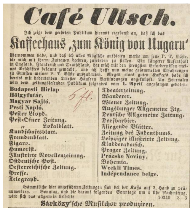
1. ábra. Az Ultsch-kávéház hirdetése a Pesth-Ofner Localblatt und Landbotéban, illetve a Pester Lloydban 257