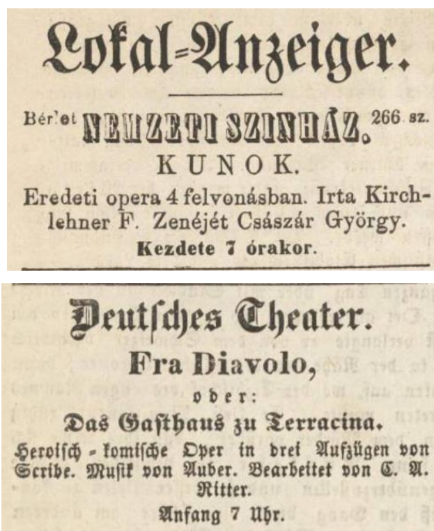
3. ábra. A „Lokal-Anzeiger” részletei az „Inserate” rovat részeként, Pester Lloyd 1857. február 27. és 1857. január 9.

A „Lokal-Anzeiger” így 431 zenés eseményt (opera, népszínmű, vaudeville , zenés színmű, balett stb.) regisztrál a pest-budai színházakban 1857-ben. A „Lokal-Anzeiger” olykor az „Inserate” rovatban kapott helyet – itt a Pesth-Ofner Localblatt und Landboté hez hasonló megoldással élve a színlapok miniatűr kivonatai kerültek feltüntetésre. (3. ábra)